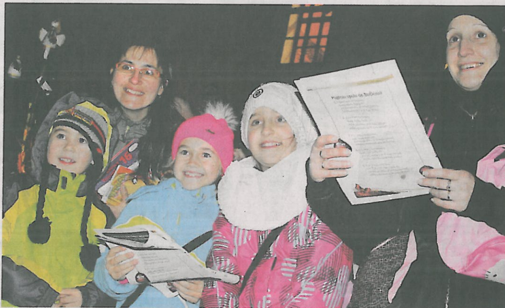
Spokojení účastníci při předloňském zpívání v atriu lounské knihovny.

Kromě hlavního místa dění v areálu lounské knihovny na náměstí se bude v okrese Louny týž den zpívat i na mnoha dalších místech, především ve školách, vesnických knihovnách a domovech