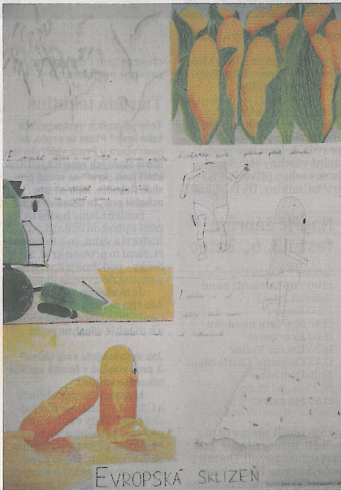
Evropská sklizeň kukuřice v roce 2050 by mohla probíhat možná už skoro sama. Na soutěžním obrázku to pěkně ztvárnila sedmnáctiletá Daniela Patzaková z Loun. Přihlásila ji také tamní umělecká škola.